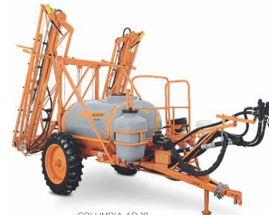
COLUMBIA AD 18