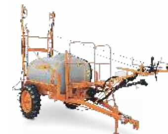
CORAL B 12

* Masterflow acionado a cabo e comando hidráulico por mangueira.