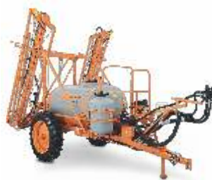
COLUMBIA AD 18