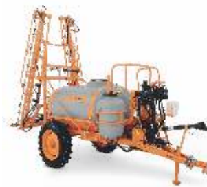
CORAL AM 14