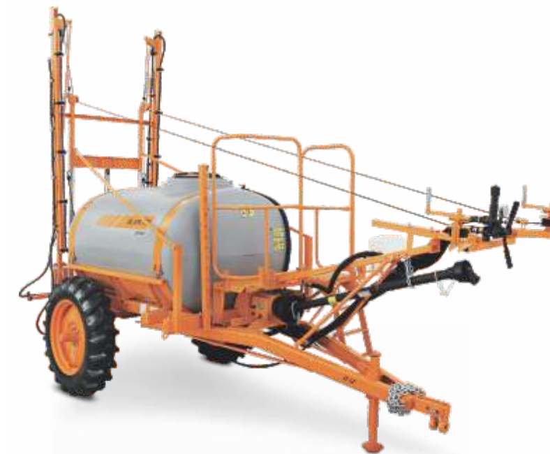
CORAL B 12