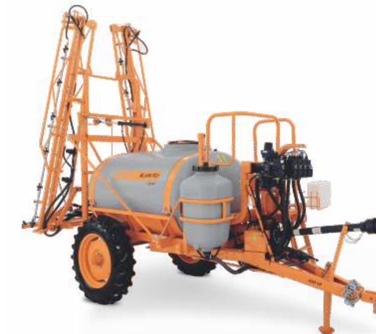
CORAL AM 14